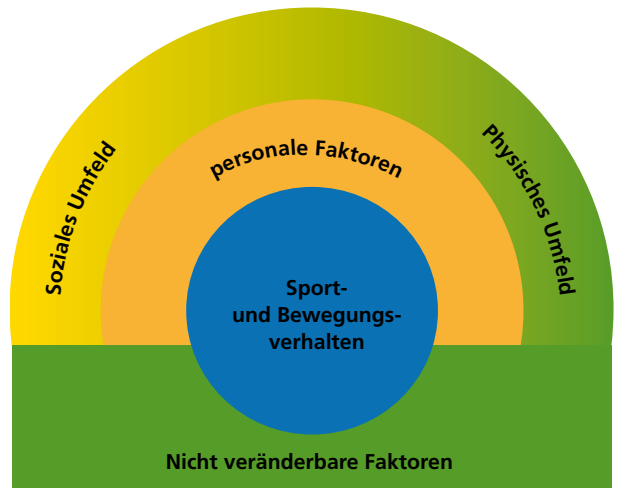
Abbildung 3: Einflussfaktoren auf das Sport- und Bewegungsverhalten (Determinanten). Das Sport- und Bewegungsverhalten wird beeinflusst von Faktoren, die nicht verändert werden können (Vererbung, Alter, Geschlecht), und solchen, die veränderbar sind. Dazu gehören persönlichkeitspezifische Faktoren sowie solche aus dem sozialen und physischen Umfeld.